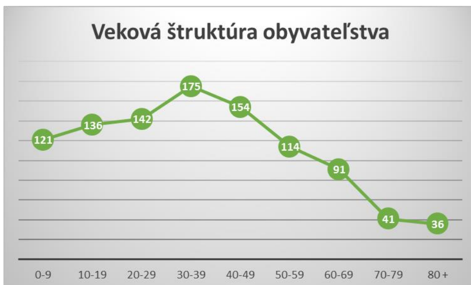
Graf č.2 Veková štruktúra obyvateľstva

(k 31.12.2014)