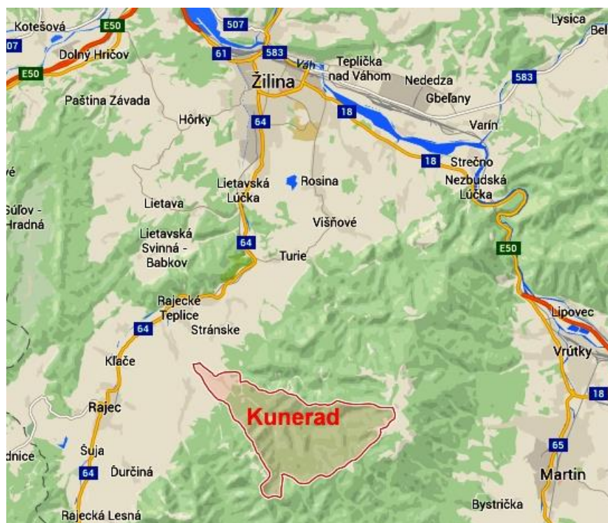
Obr. č.6 – Poloha obce Kunerad na mape