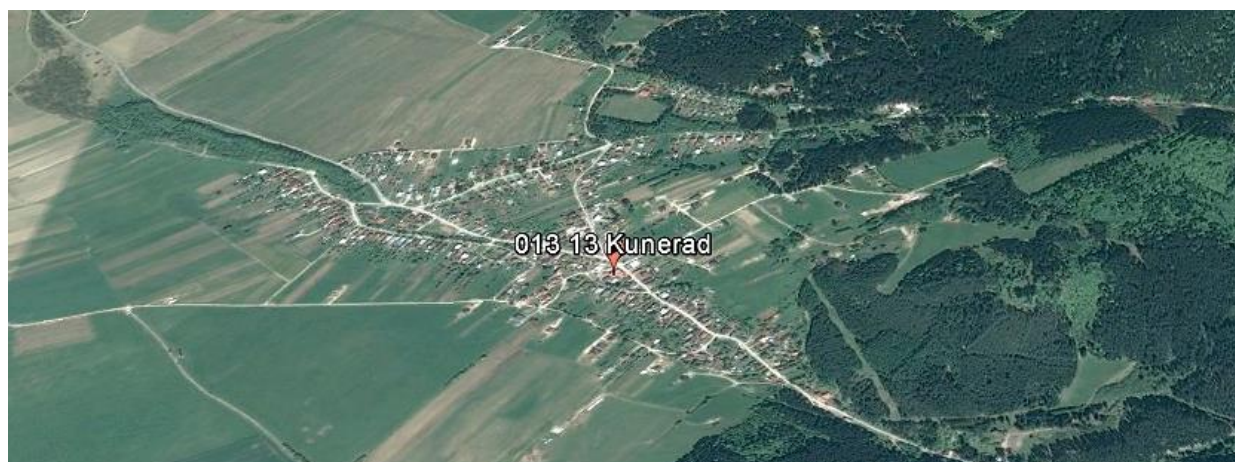
Obr. č.1 - Letecká snímka na Obec Kunerad