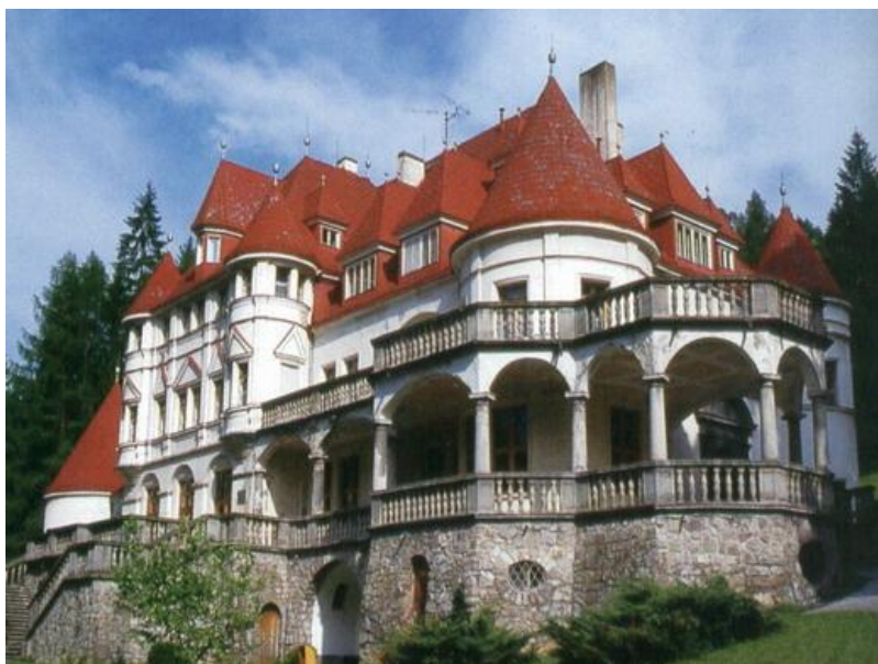
Obr. č.5 – Kúneradský zámok